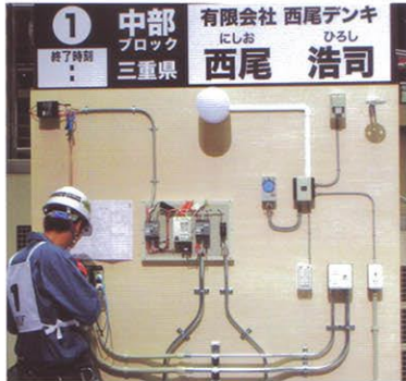
西尾選手競技模様