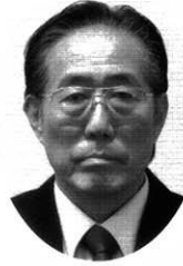
株式会社三重県電気工事協会の 代表取締役社長