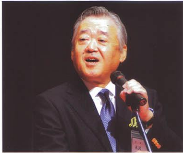
米沢会長あいさつ