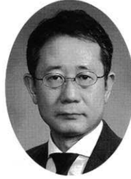
中部電力株式会社 執行役員三重支店長