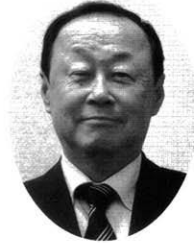
三重県電気工事業工業組合