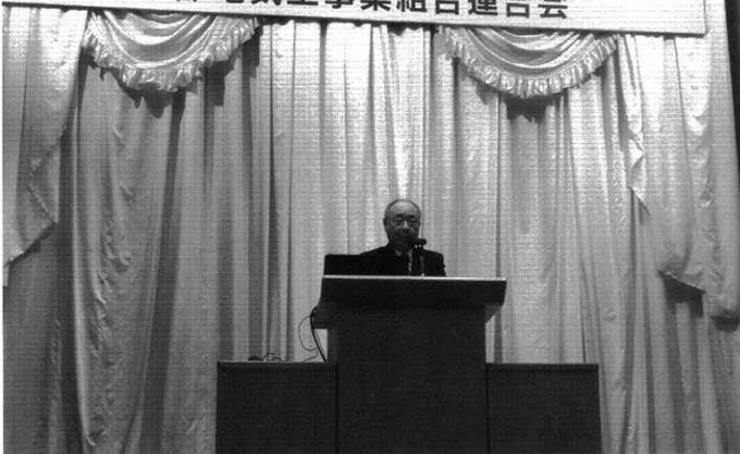
藤沢会長あいさつ