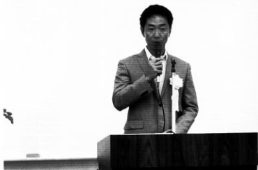
青年部長あいさつ