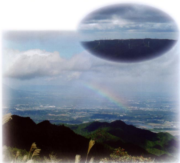
経ヶ峰と青山高原