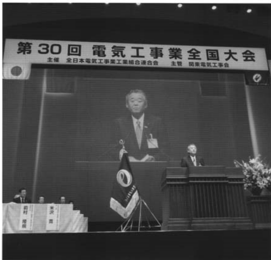
米沢会長あいさつ

十一月十四日に第三十回電気工事業全国大会が、横浜市で開催された。三重県工組からは、県役員