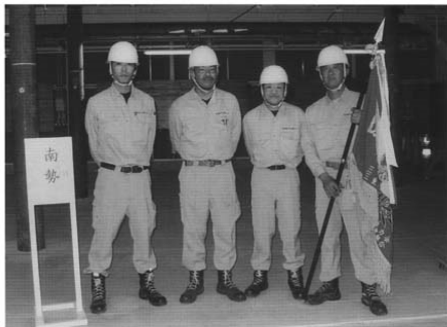
優勝チーム（南勢チーム）

栄えある優勝は、南勢チーム・準優勝は、桑員チームとして努力賞は、伊勢チーム・鈴鹿チームとなり、それぞれ表彰されました。南勢チーム・桑員チームは、更に十一月七日に行われる中部大会に出場が決定した。