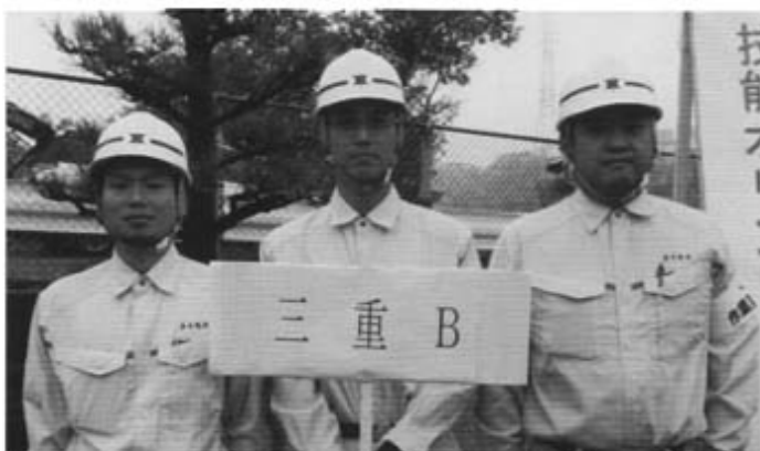
準優勝(桑員チーム)