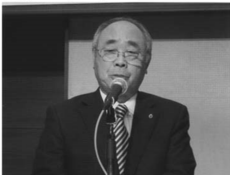
藤沢会長あいさつ

中部電気工業事業組合連合会は、十月二十一日長野県長野市の「ホテルメトロポリタン長野」において、平成二十五年経営セミナーが開催