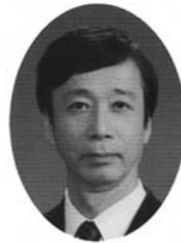
中部電力株式会社 執行役員三重支店長