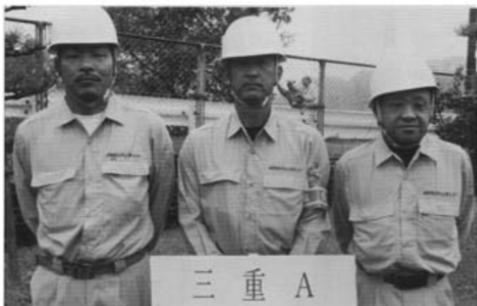
準優勝(南勢チーム)

なお、三重県大会・中部大会を通じて培った技術と安全作業能力を今後の電気工事等に反映していただくとともに、継続した後進の育成に尽力していただきたいと思います。