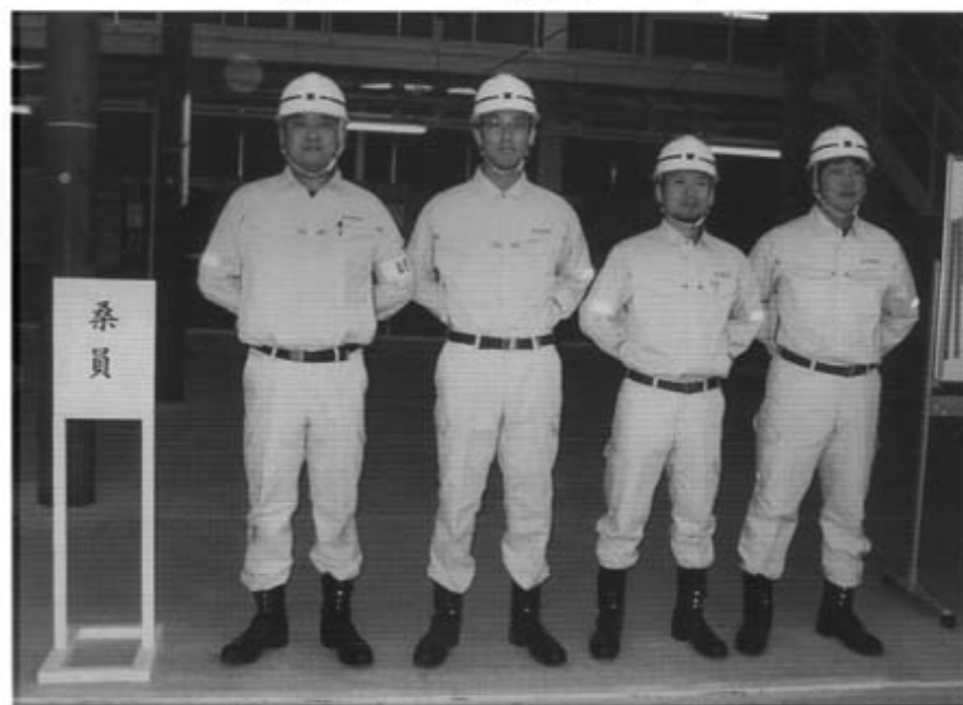
準優勝チーム（桑員チーム）