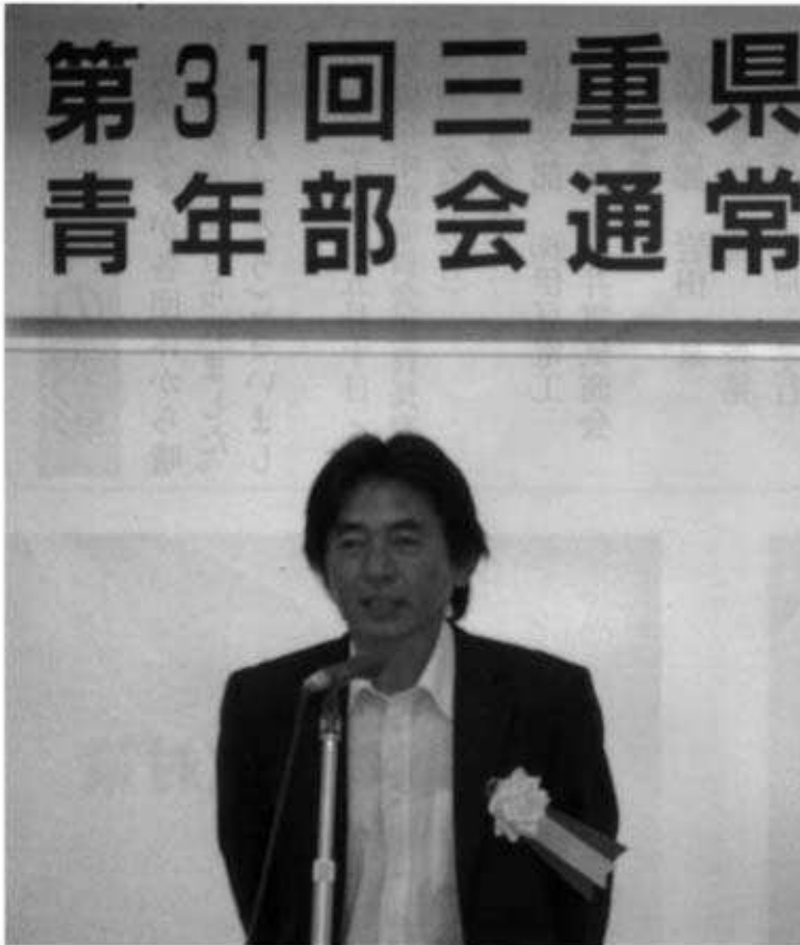
青年部会長あいさつ

百八名（内委任出席五十八名）が出席、来賓として楠理事長・石原・飯田各副理事長が出席された。上野支部南出