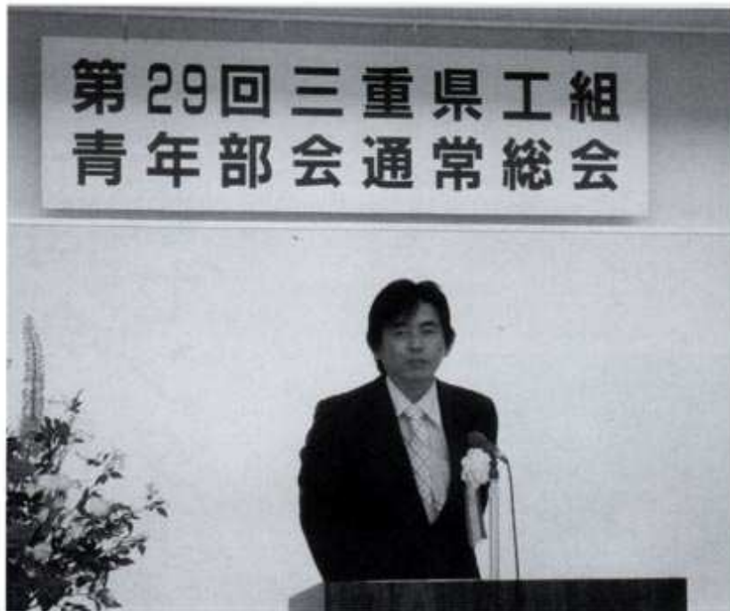
青年部会長あいさつ

休憩の後、三重県環境森林部地球温暖化対策室による「三重県の地球温暖化対策及び行政からの補助制度」の講演会が開催され、十七時に終了した。