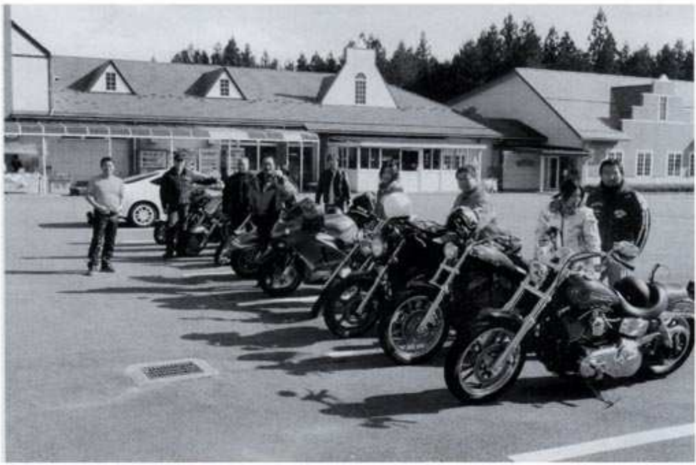
2009年11月8日(日) 駒ヶ根ソースかつ井ツーリング

に出かけ、いろんな話ができる事を楽しみにしております。それまで私は事故らんにように安全運転でがんばっていきたくてあります。