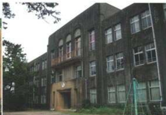
登録有形文化財「旧鳥羽小学校」