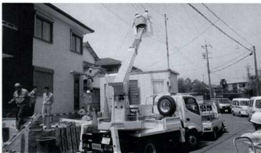
合同会社鈴鹿電気引込工事センター作業風景