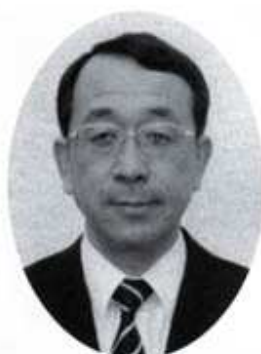
中部電力株式会社 執行役員三重支店長