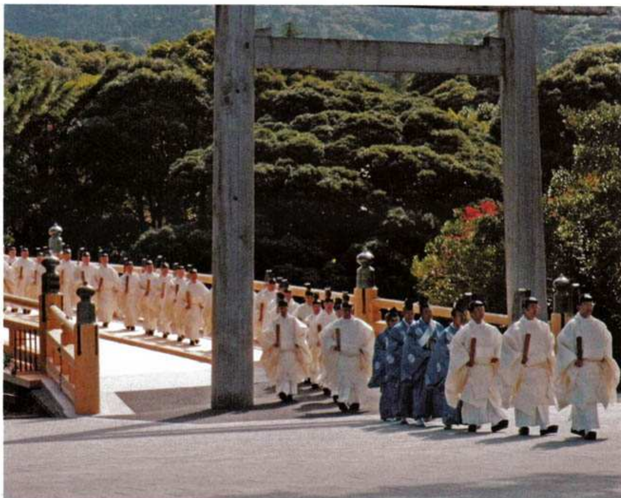
宇治橋渡初め(伊勢支部)