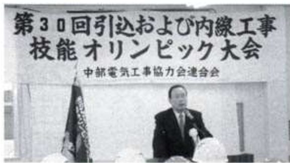
楠中部電気工事協力会連合会会長あいさつ