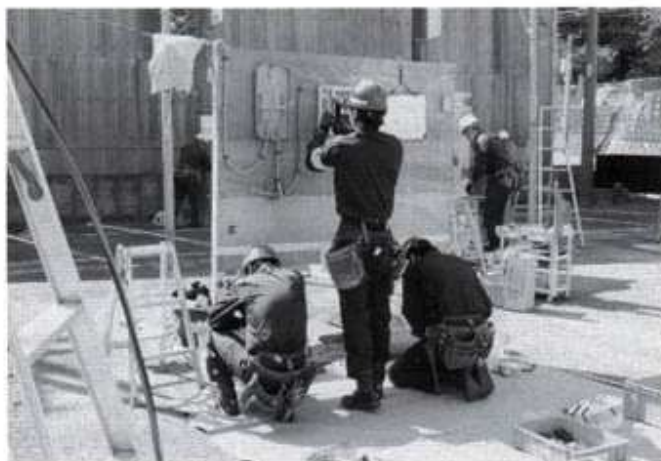
競 技 風 景

栄えある優勝は、四日市 チーム・準優勝は、上野チ ームそして努力賞は、大台チ ーム・伊勢チーム・亀山チ ームとなり、それぞれ表彰さ れました。四日市チーム・ 上野チームは、更に十一月 十一日に行われる中部大会 に出場が決定した。