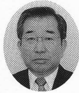
中部電力株式会社 取締役三重支店長