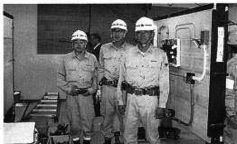
員弁チームのみなさん