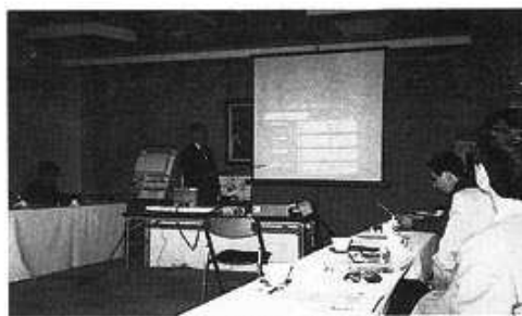
技術委員会研修風景

識し今後は、この研修情報を各支部技術委員を通じ組合員の皆様へ提供し、業務に反映していただきます。