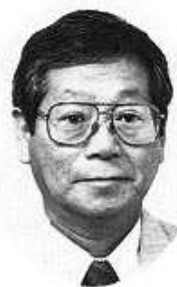
三重県電気工事業工業組合