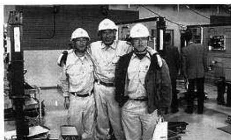
鳥羽チームのみなさん