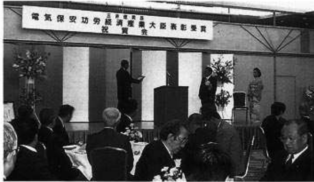
全日電工連からの賀詞贈呈