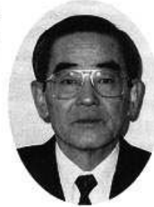
中部電力株式会社 取締役三重支店長