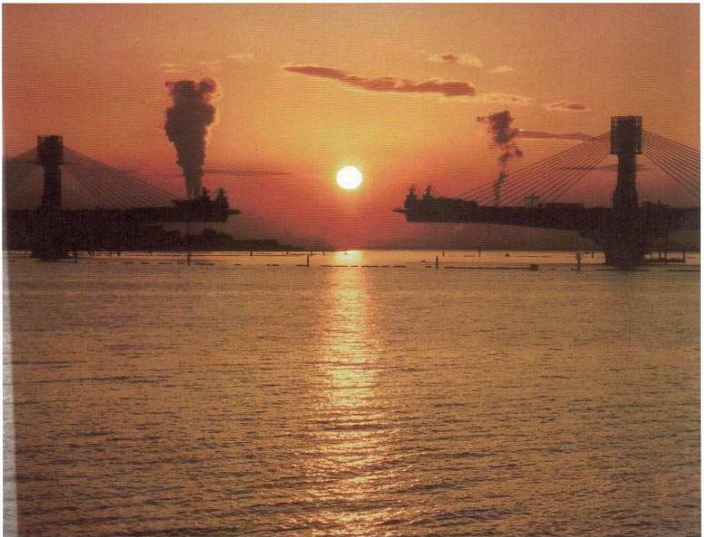
「桑名市から見る第二名神の朝日」