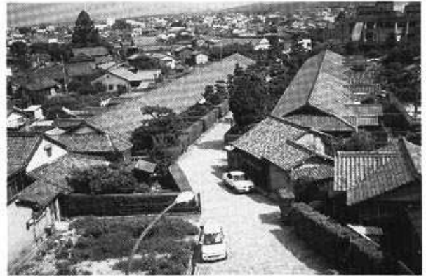
武家屋敷(御城番屋敷)

秋は紅葉、藤の大樹は盛季には一メートル余りの花房が見事に咲き誇り、四季折々の姿は訪れる多くの人々を楽ませてくれます。その他、鈴屋屋敷(本居宣長の旧宅)が城下にあります。城の裏門前の武家屋敷(御城番屋敷)は、江戸時代松阪城の警備を任務とする紀州藩士とその家族の住居として建てられた家屋が今も昔と変わりなく子孫の方々が管理され、そのたた