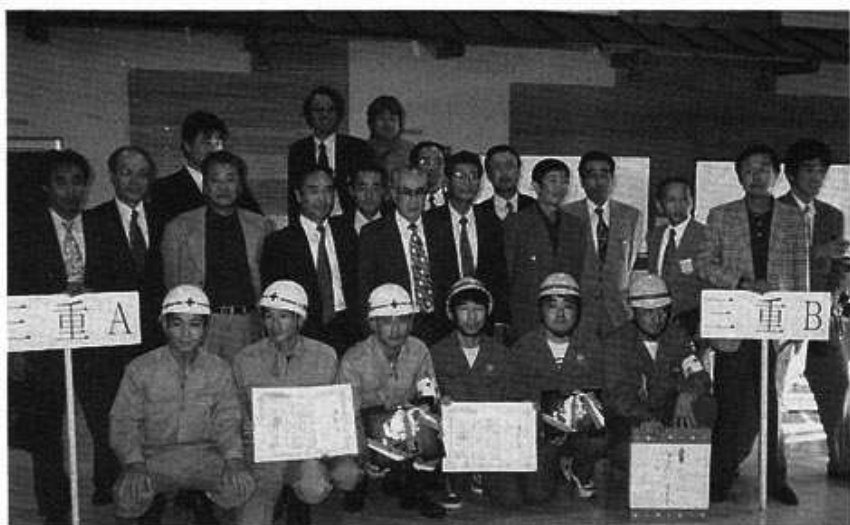
三重A 伊勢チーム 三重B 上野チーム

名)は第三位に入賞、また安全賞では、上野チームが第二位、伊勢チームが第三位にそれぞれ入賞した。三重県チームが、その技術が高く評価され、選手はもちろんのこと、技術委員始め関係各位のご努力に感謝いたします。