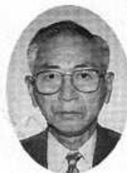
倉田副理事長 (副会長)