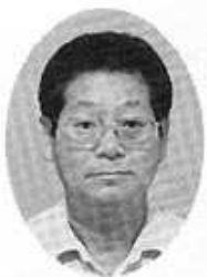
植田副理事長 (副会長)