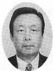
楠副理事長 (副会長)