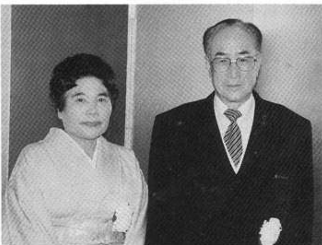
ご 夫 妻