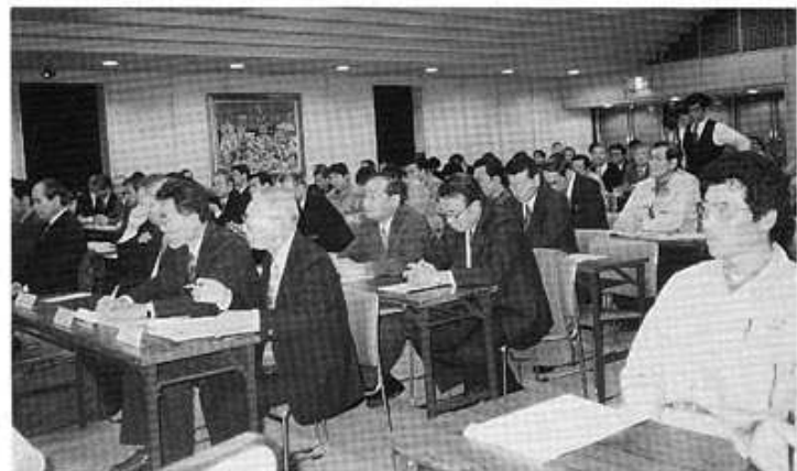
熱心に聞き入る参加者

している旨の挨拶が有り、休憩を挟んで十チームがそれぞれの職場での安全に対する問題点をテーマとして「現状の課題」「具体的な対策」「成果と今後の方針」について熱心な発表が行われた。