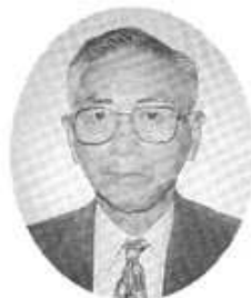
倉田副理事長 (副会長)