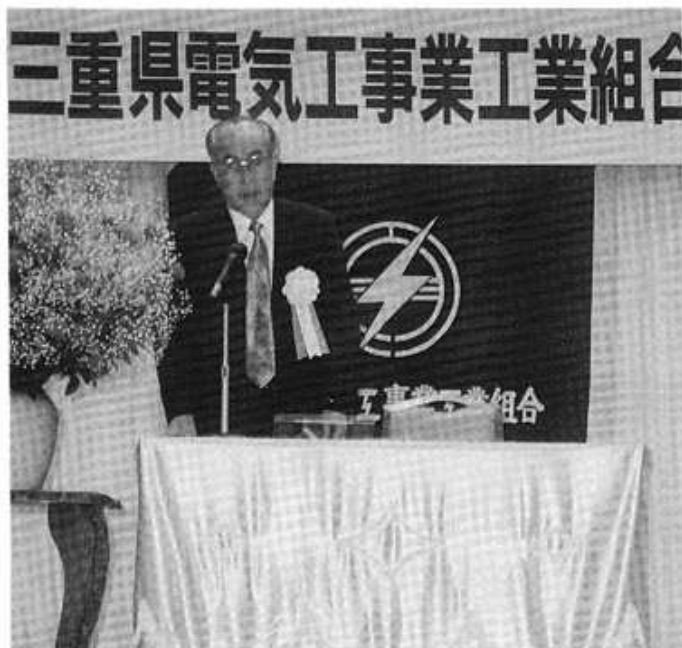
あいさつする青山理事長・会長

このたび五月二十四日に開催された工業組合第31回 協力会第51回総代会において理事長・会長に再選され