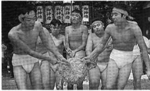
おみおく練り(東貝野)

太鼓づくりなどこれらの伝統文化は、地域住民の共有の財産であるとともに北勢町のまちづくり、人づくりに欠かせない活力源である。 間もなく盛大にくり広げられる八幡祭がやって来ます。若者達が夜を徹して鐘と太鼓を町中に響きわたらせワッショイノ、ワッショイノ、のかけ声と共に、おみこしが行き交うさまは勇壮で心ひきしまる伝統文化であると思います。最近では、名古屋、岐阜方面から