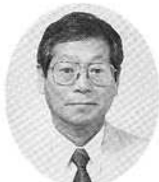
植田副理事長 (副会長)