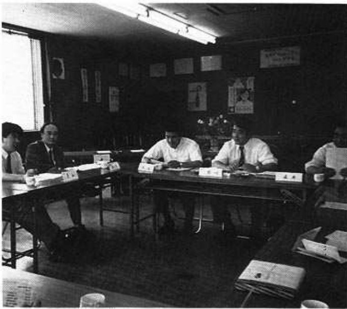
なごやかな雰囲気の中での幹事会