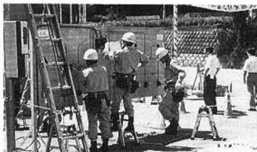
平成2年度オリンピック大会風景

日程は、 三重県大会 九月十六日 津電気会館 中部大会 十月七日 中電人材開発センター