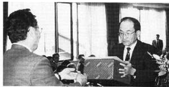
中部電力(株)三重支社より感謝状贈呈

変更等が発生した第一種電気工事士の方々は、直ちに三重県電気工事業工業組合に変更届を提出してください。