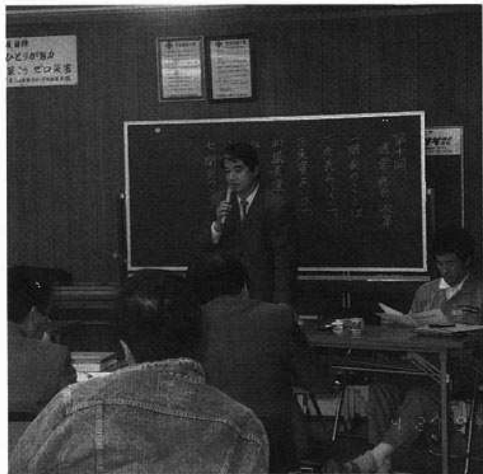
市川会長就任あいさつ

工事業界に少しでも寄与できる青年部会となりますよ。う努力して行きたいと思えます。