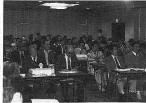
表彰を受ける皆さん