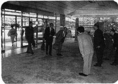
各県役員をお迎える 当県役員

第82回中部電気工事協力会連合会の総会は、5月晴れの好天に恵まれた去る5月17日、長島町ホテル「花水木」において盛大に開催された。