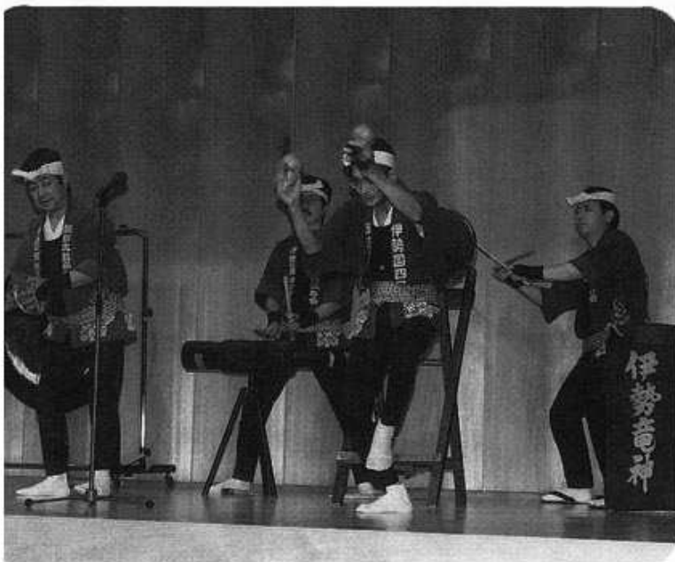
懇親会アトラクションでの四日市・阪訪太鼓