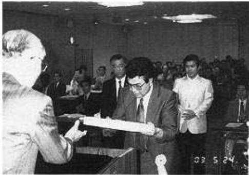
特別優良技能店の表彰伝達