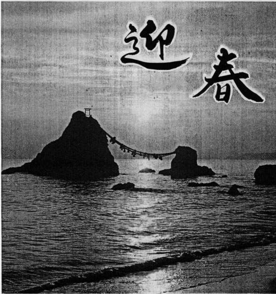
伊勢二見浦夫婦岩日の出