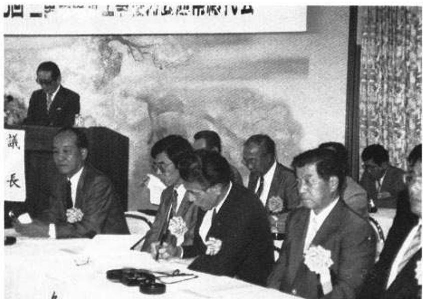
協力会、総代会に出席された顧問・参与