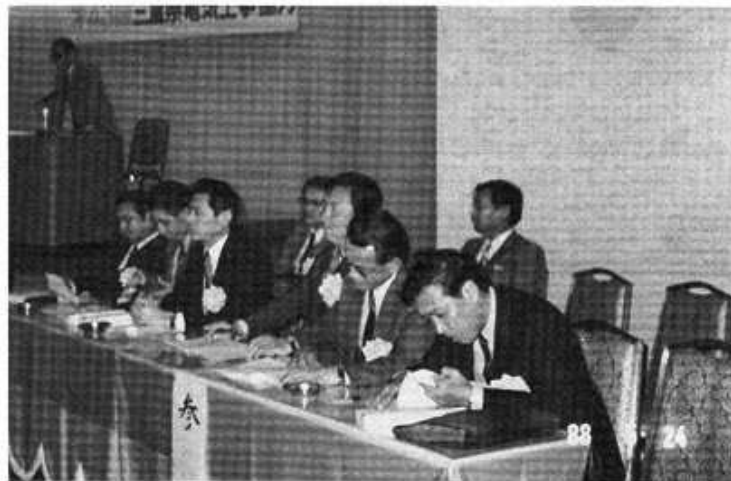
協力会総代会に出席された顧問、参与

可決され、各支部から選出された選衡委員により別項のとおり新役員を満場一致で選出、引き続き開催された理事会においてそれぞれの役職が決定就任承諾された。なお関連事業の報告