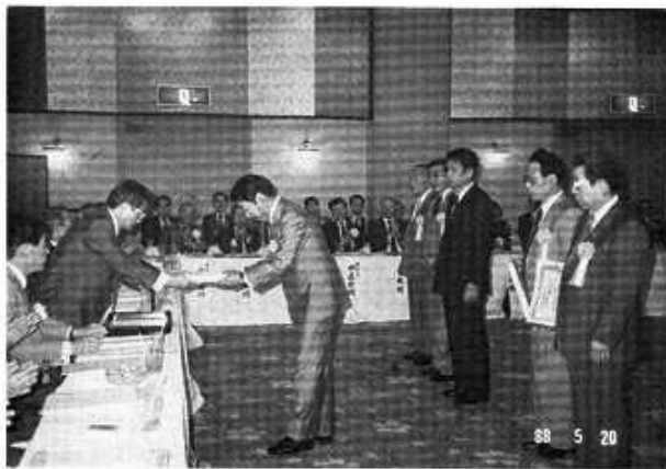
(協)連合会総会における受賞