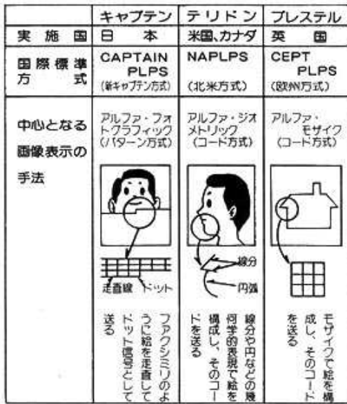
代表的なシステムとその画像表示手法

情報センターとテレビなどの端末機を電話回線で結ぶことにより、情報サービス提供者と利用者との間で、文字だけでなく画像も含めた情報のやりとりができる多方向画像情報通信システム。 利用者側の端末から情報センターの画像データベースを検索して必要な情報画面を引き出すことができ、また、その画面に応じて端末から応答データを送ることができるため、商品