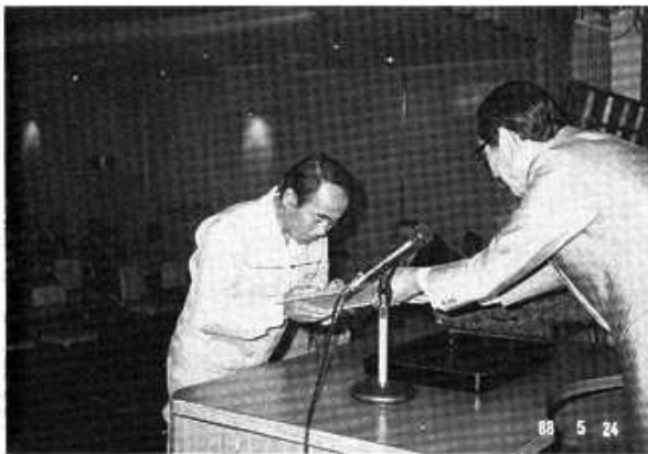
総代会における協力会会長表彰