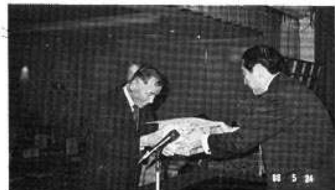
中部電力津支店長感謝状