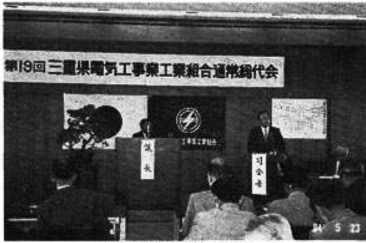
改正案の提案説明

なお新給付金規程は、全員が加入される見込みの五九年十月一日実施を目標といたしております。