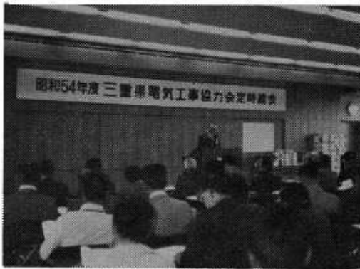
総会における会長あいさつ

に集中したものの期待した民間設備投資の大幅な増加が見られず電気工業業界は前年度にも増して厳しい状況であった。この様な推移のなかで当組合では、経済委員会を中心に共同保守管理業務の推進に力を入れる一方技術営業分野の